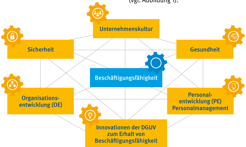
Abb. 1 Wichtige Einflussgrößen auf Beschäftigungsfähigkeit und ihre Querbezüge

Als Strukturierungshilfe der Schrift werden Themenbereiche herangezogen, welche für Betriebe und Bildungseinrichtungen sowie die gesetzliche Unfallversicherung von zentraler Bedeutung sind (vgl. Abbildung 1).